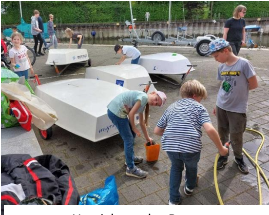
Herrichten der Boote

Für die Optikinder finden diese wöchentlich statt während die älteren Mitglieder themenspezifische Veranstaltungen besuchen können. Der Frühling bringt dann unseren Elterninfoabend mit einem Flohmarkt für gebrauchte Segelausrüstung mit. Kurz darauf werden die Jugendboote – die Optis, 420er und Laser – den jeweiligen Seglerinnen und Seglern zugeteilt.