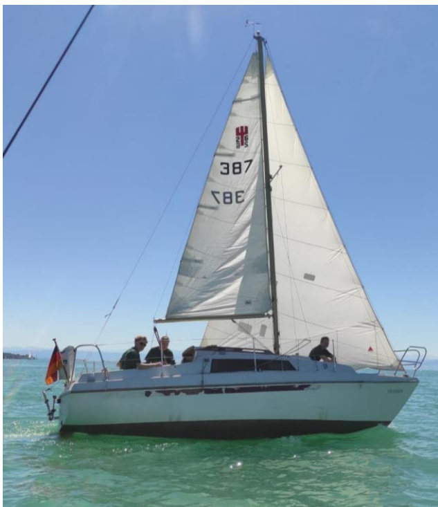
Die Neptun 26, das große Jugendboot

die nun das Herz unserer Jugend und ein Bindeglied zum Verein ist. Wir dürfen diese ab 16 Jahren nutzen, um damit Ausflüge und Touren zu machen. (Abb. 2)